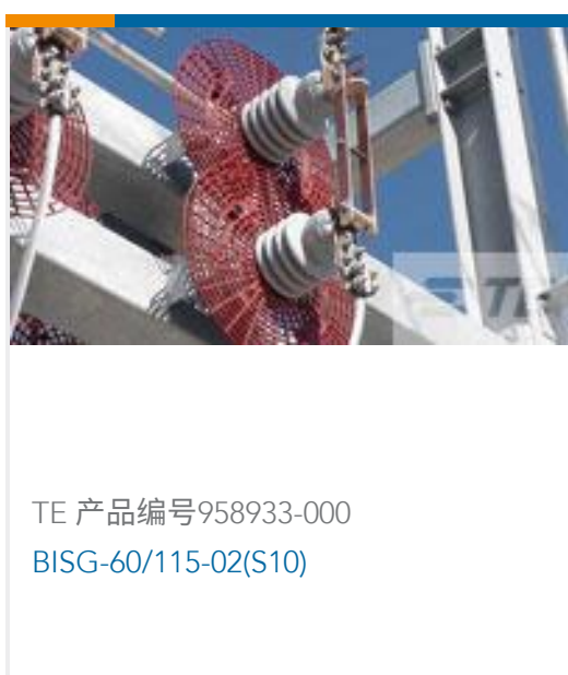
TE 产品编号958933-000 BISG-60/115-02(S10)