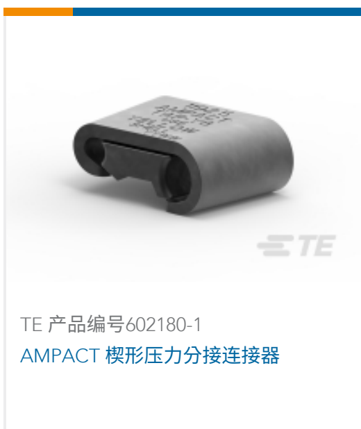
TE 产品编号602180-1 AMPACT 楔形压力分接连接器