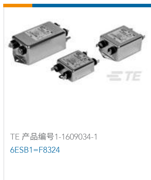
TE 产品编号1-1609034-1 6ESB1=F8324