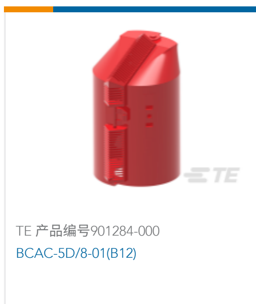
TE 产品编号901284-000 BCAC-5D/8-01(B12)