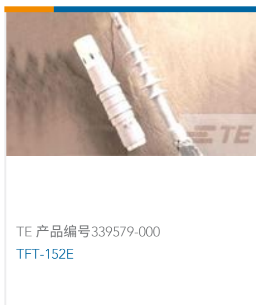
TE 产品编号339579-000 TFT-152E