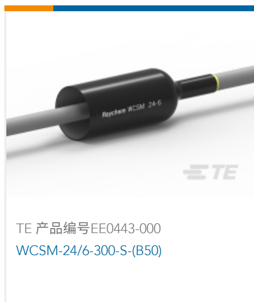
TE 产品编号EE0443-000 WCSM-24/6-300-S-(B50)