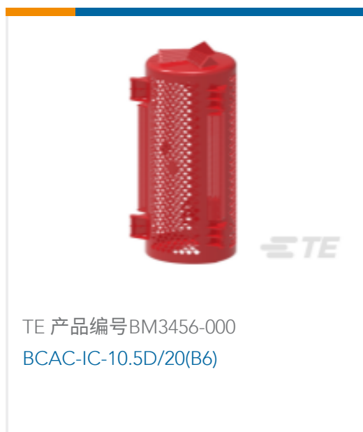
TE 产品编号BM3456-000 BCAC-IC-10.5D/20(B6)