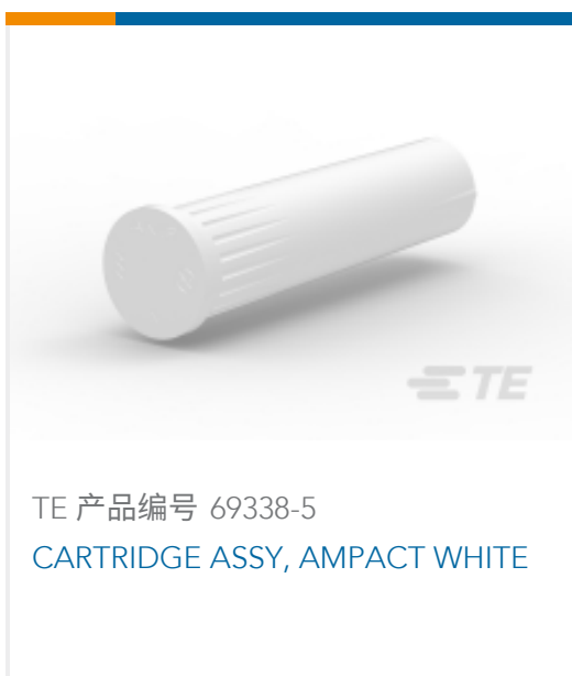
TE 产品编号 69338-5 CARTRIDGE ASSY, AMPACT WHITE