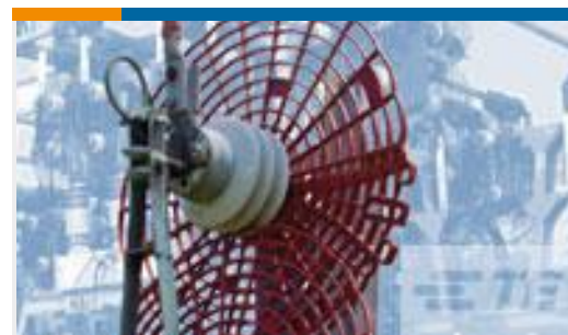
TE 产品编号CR8834-000 BISG-G-24-01(B10)