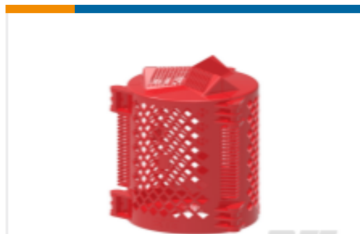
TE 产品编号CR3053-000 变压器的衬套盖