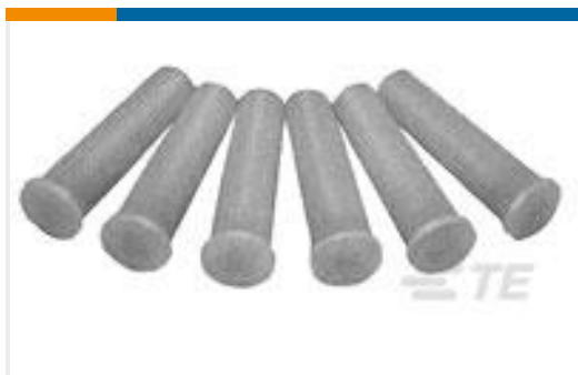
TE 产品编号69338-1 CARTRIDGE ASSY, AMPACT BLUE