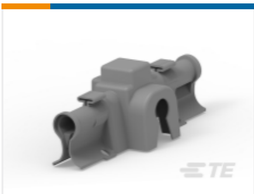
TE 产品编号EK0649-000 BCIC-GT-HZ(B6)