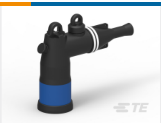
TE 产品编号BM1374-000 ELB-25-200C10