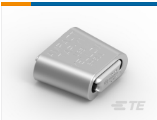
TE 产品编号83861-1 AMPACT TAP 1431 AAC-1272 ACSR