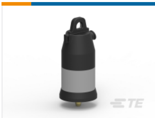
TE 产品编号EE5634-000 ELB-25-200-IC