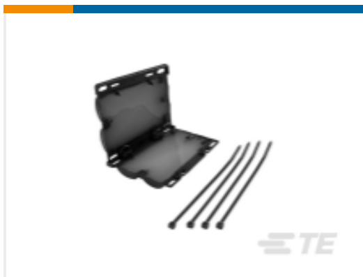
TE 产品编号1710501-1 GELPACT-SMY