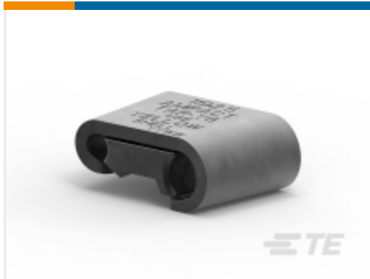
TE 产品编号602121-7 AMPACT 楔形压力分接连接器