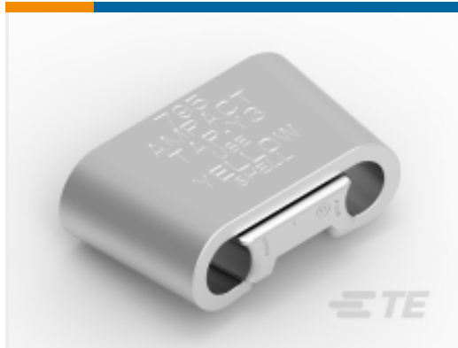
TE 产品编号1443455-6 AMPACT HTT 795.0-397.5