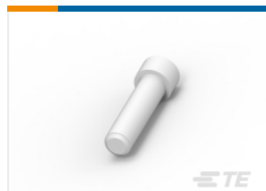
TE 产品编号114017-ZZ SEALING PLUG, SIZE 12/16, WHT