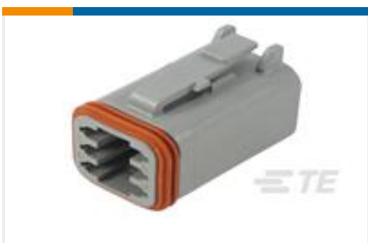
TE 产品编号DT06-6S PLG, 6P, GRY, N