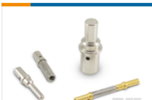
TE 产品编号0460-204-12141 DEUTSCH Solid Contacts