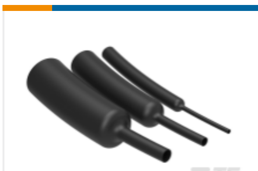
TE 产品编号6149234001 CGPT 3:1 热缩管