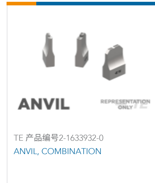
TE 产品编号2-1633932-0 ANVIL, COMBINATION