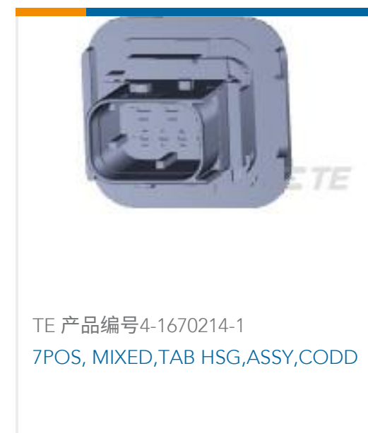
TE 产品编号4-1670214-1 7POS, MIXED, TAB HSG, ASSY, CODD COD A