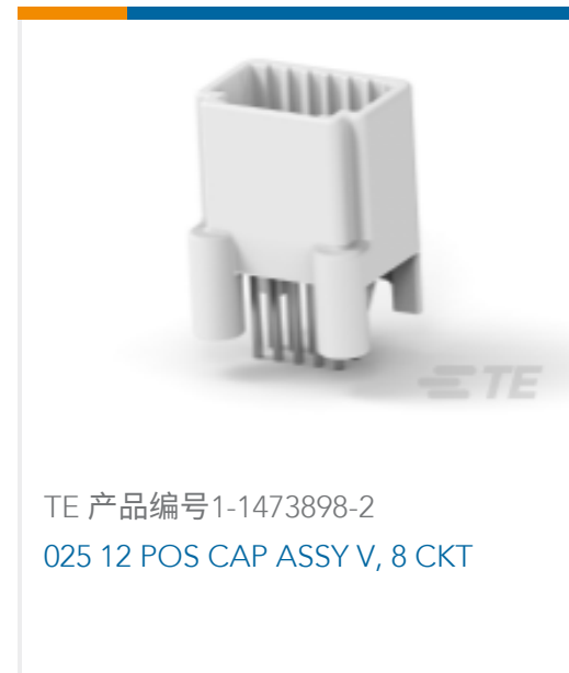
TE 产品编号1-1473898-2 025 12 POS CAP ASSY V, 8 CKT