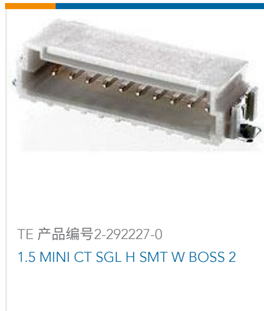
TE 产品编号2-292227-0 1.5 MINI CT SGL H SMT W BOSS 2