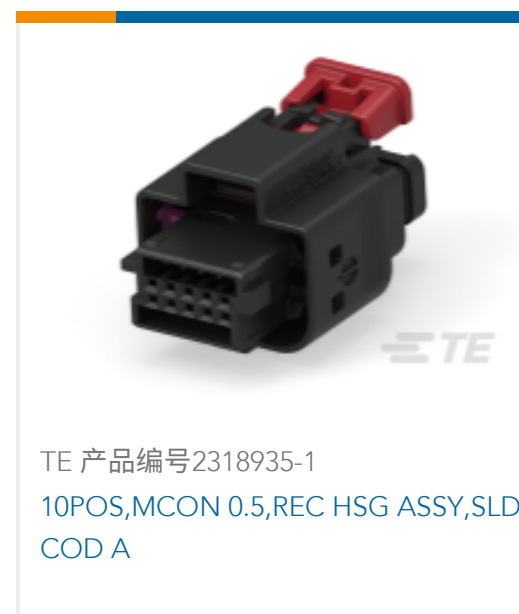
TE 产品编号2318935-1 10POS, MCON 0.5, REC HSG ASSY, SLD, COD A