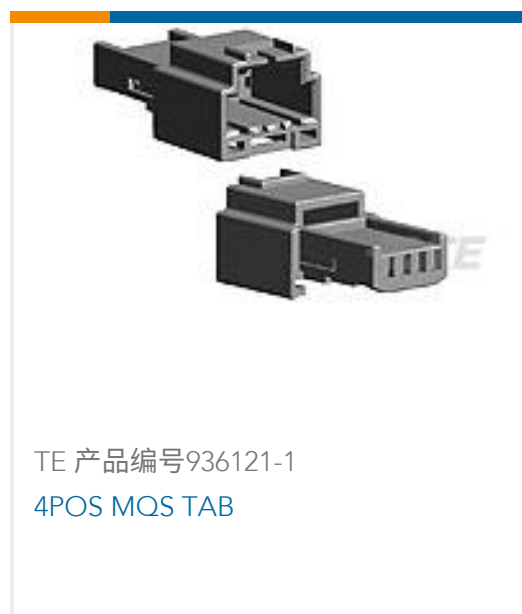
TE 产品编号936121-1 4POS MQS TAB