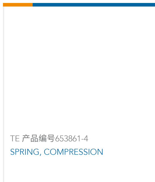
TE 产品编号653861-4 SPRING, COMPRESSION