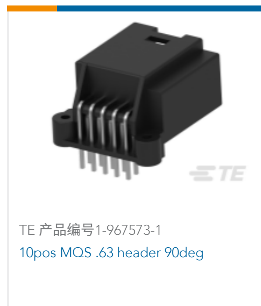
TE 产品编号1-967573-1 10pos MQS .63 header 90deg