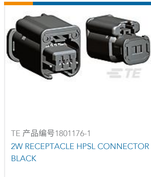
TE 产品编号1801176-1 2W RECEPTACLE HPSL CONNECTOR BLACK