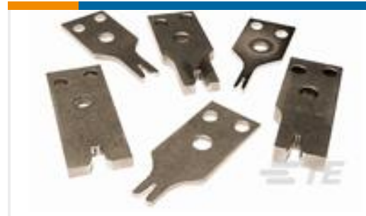
TE 产品编号2076539-2 INSULATION CRIMPER SPECIAL