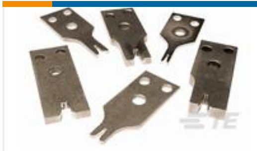
TE 产品编号2-2076295-3 WIRE CRIMPER