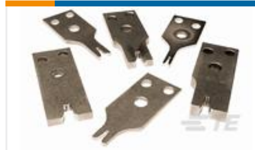
TE 产品编号8-571039-3 INSULATION CRIMPER