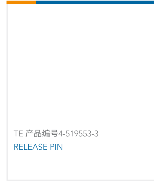
TE 产品编号4-519553-3 RELEASE PIN