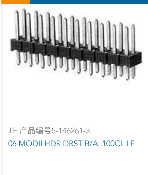
TE 产品编号5-146261-3 06 MODII HDR DRST B/A .100CL LF