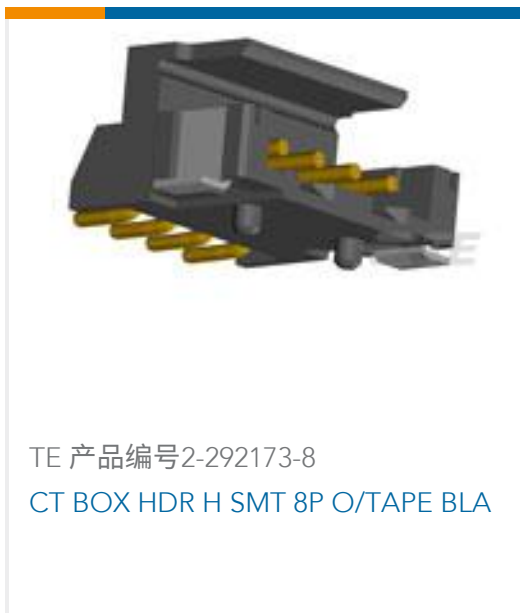
TE 产品编号2-292173-8 CT BOX HDR H SMT 8P O/TAPE BLA