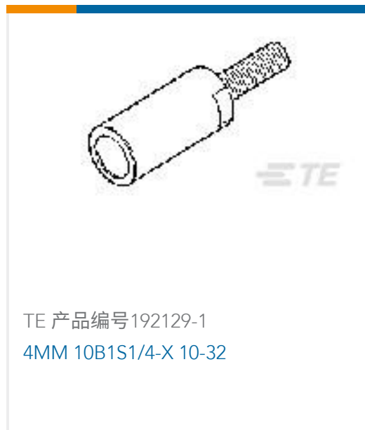
TE 产品编号192129-1 4MM 10B1S1/4-X 10-32