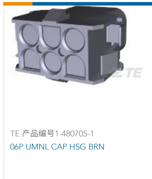
TE 产品编号1-480705-1 06P UMNLCAP HSG BRN