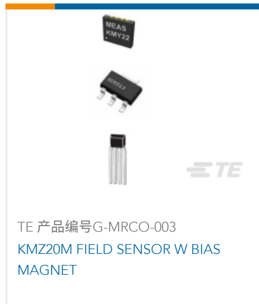
TE 产品编号G-MRCO-003 KMZ20M FIELD SENSOR W BIAS MAGNET