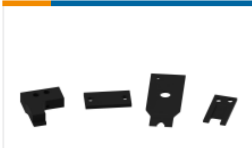
TE 产品编号755485-2 FLOATING SHEAR