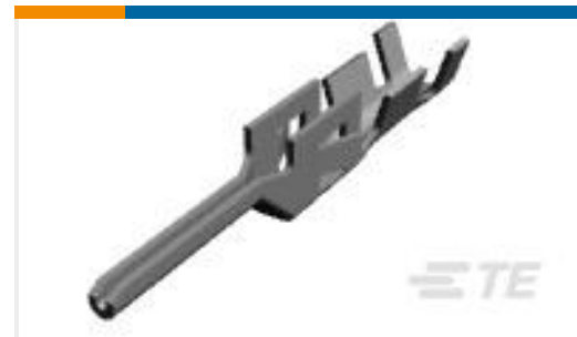
TE 产品编号 1-794612-0 PIN CONT 20-24 TIN PLATE L/P