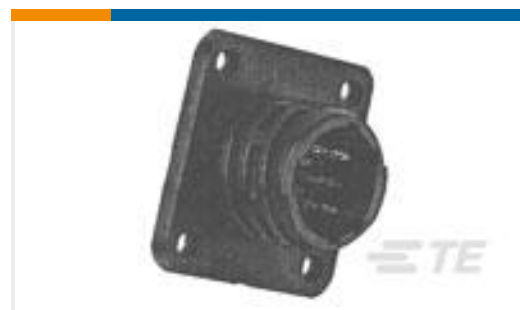
TE 产品编号 205841-1 CPC RECPT ASSEMBLY SIZE 11-8