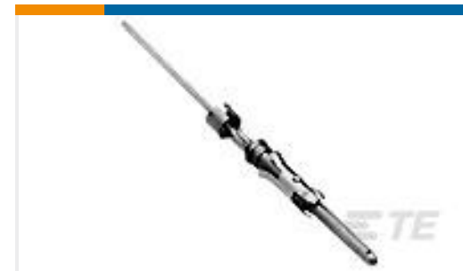
TE 产品编号 6-66460-5 PIN, .062 DIA, .025 SQ POST, LP