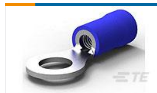
TE 产品编号 34161 TERMINAL, PG R 16-14 10