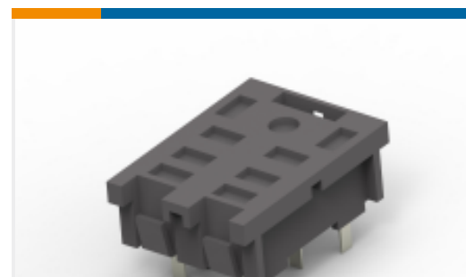
TE 产品编号 2-1419106-1 27E489=SOCKET, K10, 8, PCB, NYL