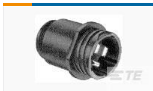
TE 产品编号 206207-1 17-3 RECEPT. FREE-HANGING