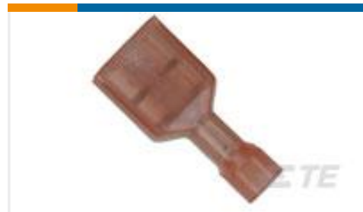
TE 产品编号 2-520183-2 ULTRA-FAST 250 ASY REC 22-18 TPBR