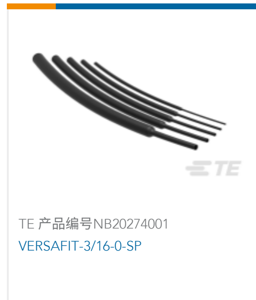
TE 产品编号NB20274001 VERSAFIT-3/16-0-SP