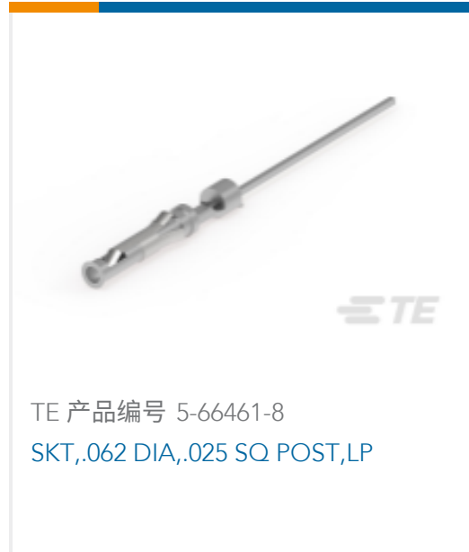
TE 产品编号 5-66461-8 SKT, .062 DIA, .025 SQ POST, LP