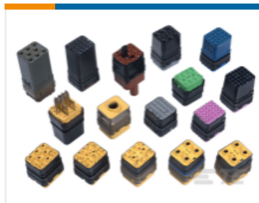
TE 产品编号ZPF00000000148762 DMC-M 99-04 AN (=33537-P0000)