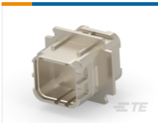
TE 产品编号ZPF00000000146309 Rectangular Connector Receptacle Extenders, Tool-less Assembly