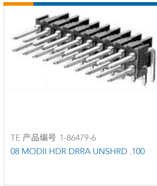
TE 产品编号 1-86479-6 08 MODII HDR DRRA UNSHRD .100