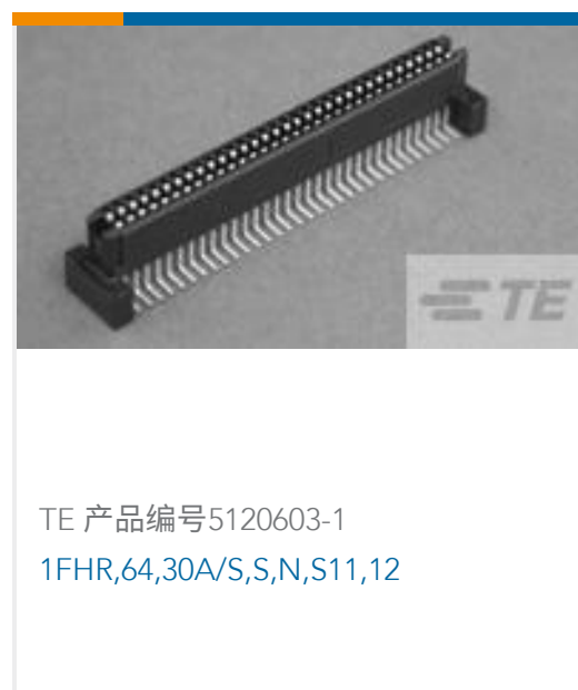
TE 产品编号5120603-1 1FHR,64,30A/S,S,N,S11,12