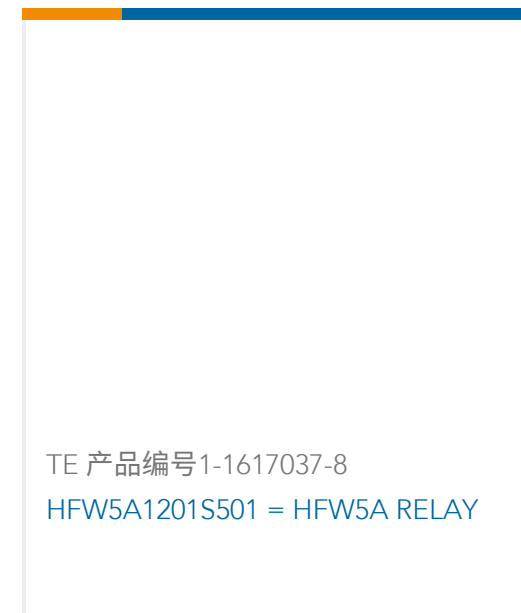
TE 产品编号1-1617037-8 HFW5A1201S501 = HFW5A RELAY