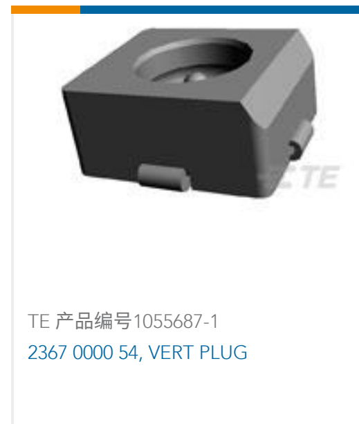
TE 产品编号1055687-1 2367 0000 54, VERT PLUG