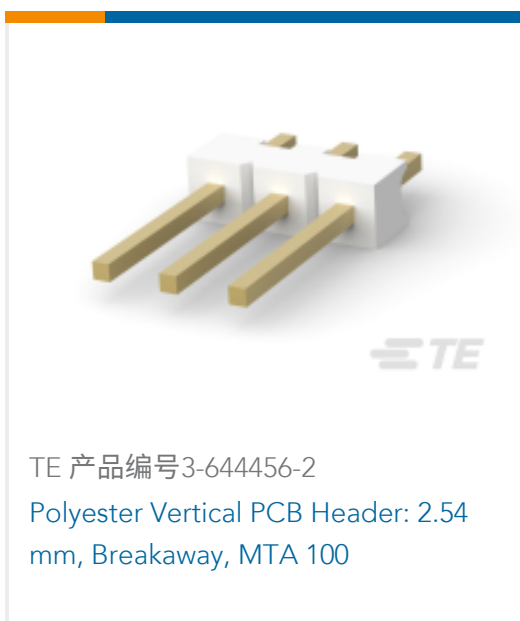
TE 产品编号3-644456-2 Polyester Vertical PCB Header: 2.54 mm, Breakaway, MTA 100