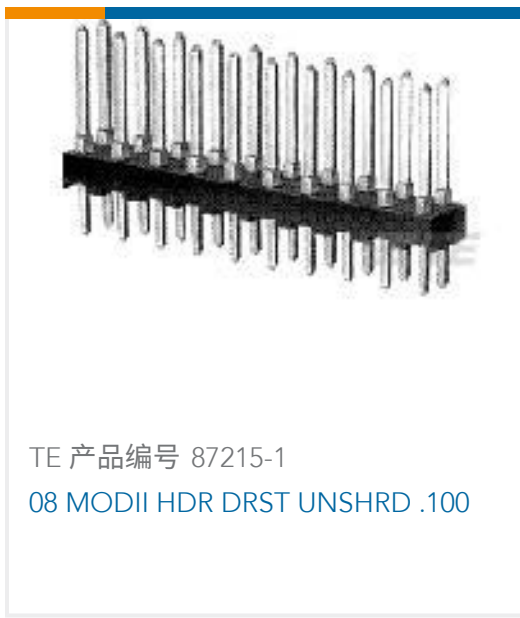
TE 产品编号 87215-1 08 MODII HDR DRST UNSHRD .100