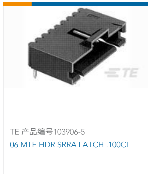
TE 产品编号103906-5 06 MTE HDR SRRA LATCH .100CL