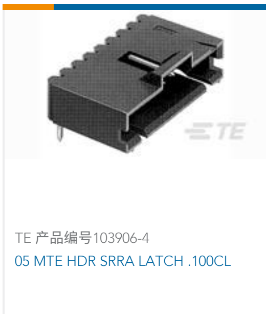
TE 产品编号103906-4 05 MTE HDR SRRA LATCH .100CL