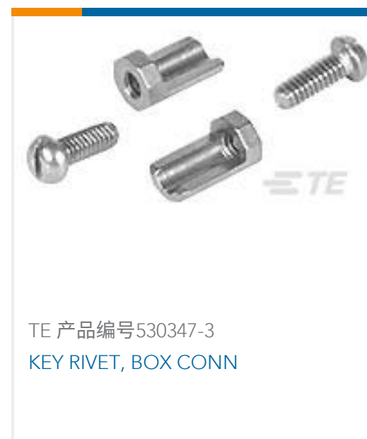
TE 产品编号530347-3 KEY RIVET, BOX CONN