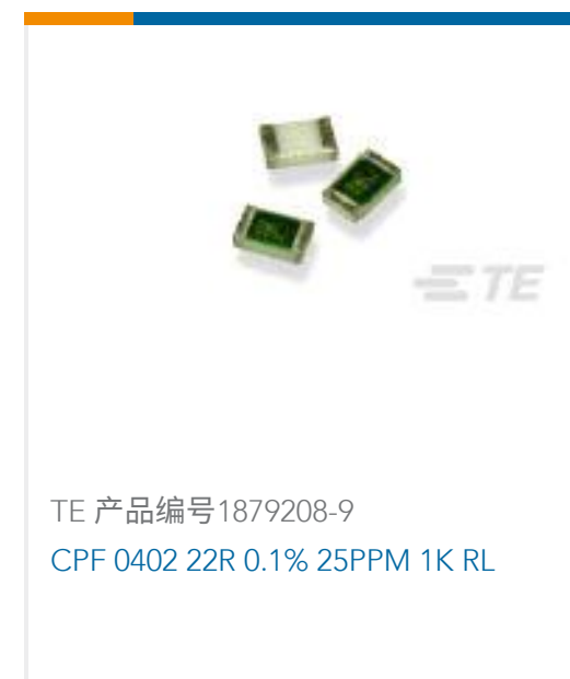
TE 产品编号1879208-9 CPF 0402 22R 0.1% 25PPM 1K RL