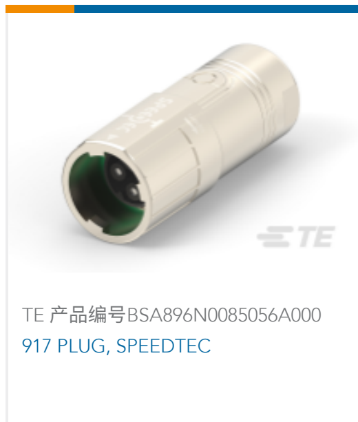
TE 产品编号BSA896N0085056A000 917 PLUG, SPEEDTEC