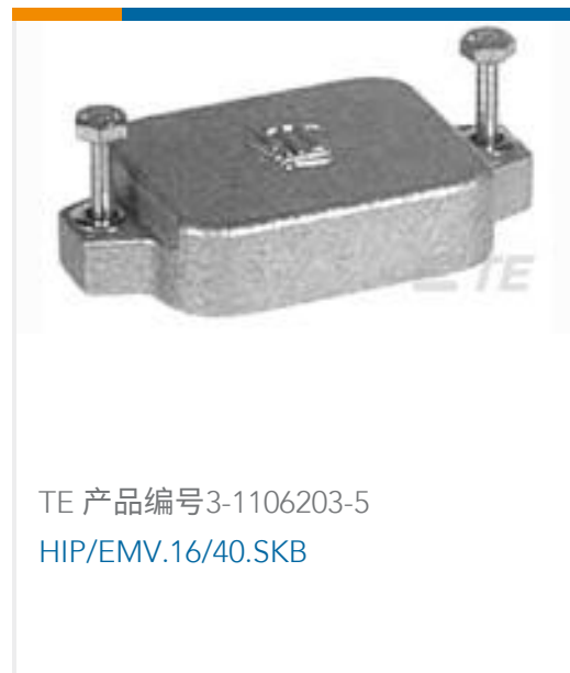
TE 产品编号3-1106203-5 HIP/EMV.16/40.SKB