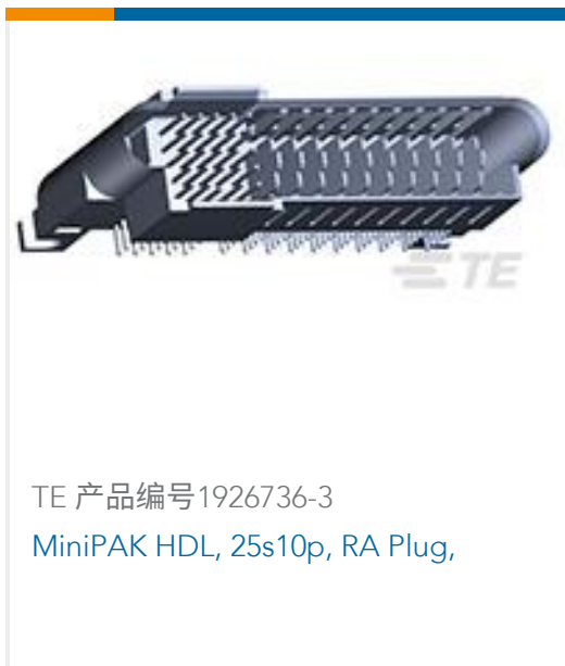
TE 产品编号1926736-3 MiniPAK HDL, 25s10p, RA Plug,