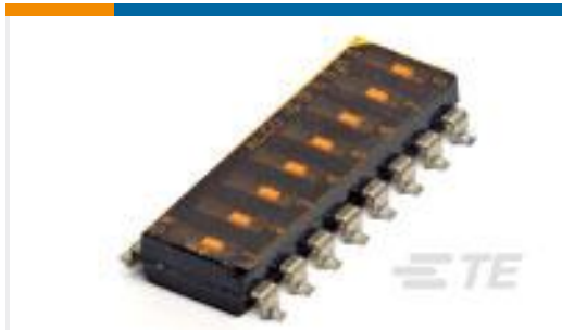
TE 产品编号1-1825006-9 GDS10S04=DIP SW,SLIDE,SMT