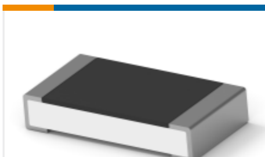
TE 产品编号4-2176391-7 RQ 1206 37K4 0.1% 10PPM 5K RL