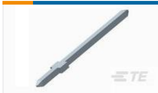
TE 产品编号1-928836-2 MOD2 PIN WITH A-PIN L/P