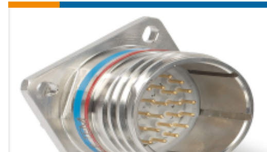
TE 产品编号YDTS20W23-53SAV001 RECP ASSY