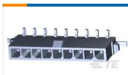
TE 产品编号2-1445087-9 MICRO MNL HDR ASSY S/ROW AU LF