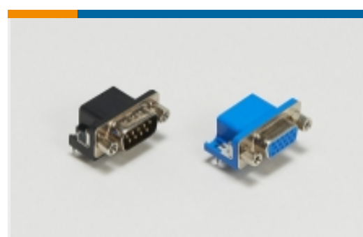
PCB D-Sub 连接器(172)