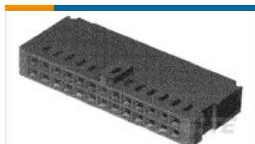
TE 产品编号102387-3 16 MODIV HSG COMP DR .100 POL