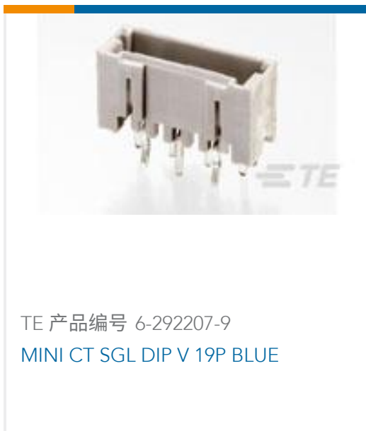
TE 产品编号 6-292207-9 MINI CT SGL DIP V 19P BLUE