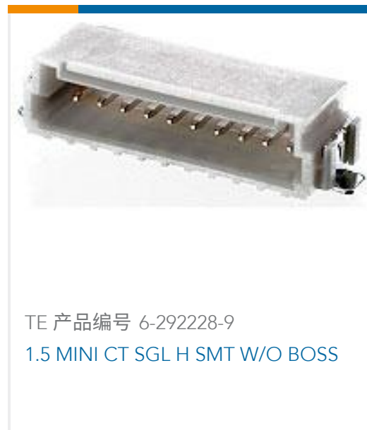
TE 产品编号 6-292228-9 1.5 MINI CT SGL H SMT W/O BOSS