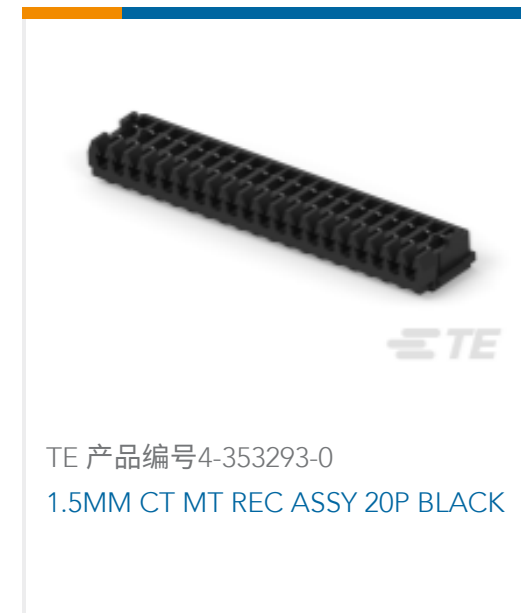
TE 产品编号4-353293-0 1.5MM CT MT REC ASSY 20P BLACK