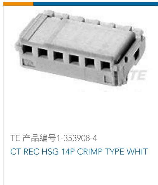
TE 产品编号1-353908-4 CT REC HSG 14P CRIMP TYPE WHIT