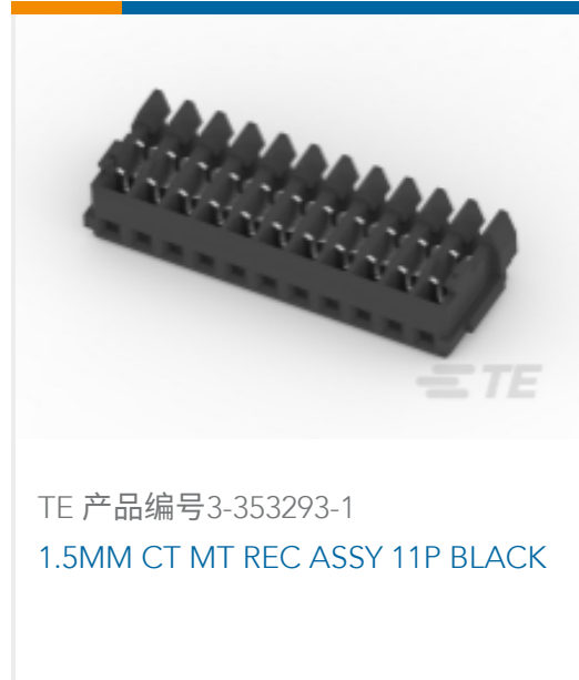
TE 产品编号3-353293-1 1.5MM CT MT REC ASSY 11P BLACK