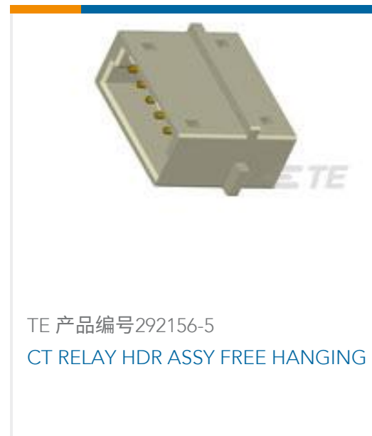
TE 产品编号292156-5 CT RELAY HDR ASSY FREE HANGING