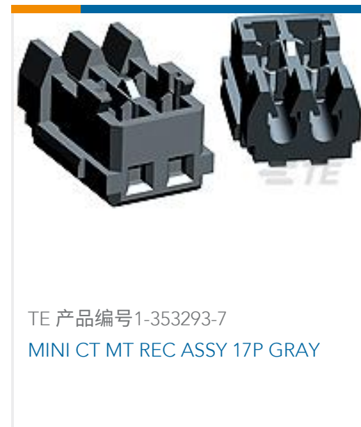
TE 产品编号1-353293-7 MINI CT MT REC ASSY 17P GRAY