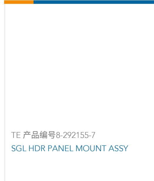
TE 产品编号8-292155-7 SGL HDR PANEL MOUNT ASSY