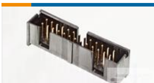
TE 产品编号5103309-5 A/L LOW PRO HDR 20P VERT BLACK