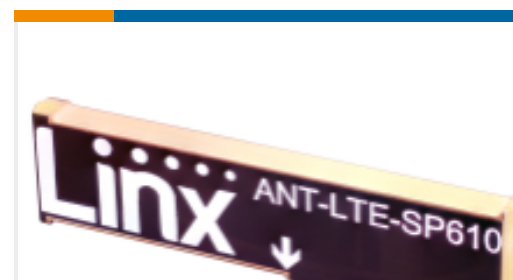
TE 产品编号ANT-LTE-SP610-T Antenna SP610 PCB RPC LTE SMT T&R