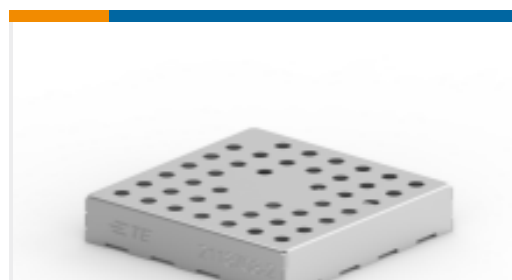
TE 产品编号2118708-2 1 PC STD SHIELD, CRS-26.21X26.21X5.08MM