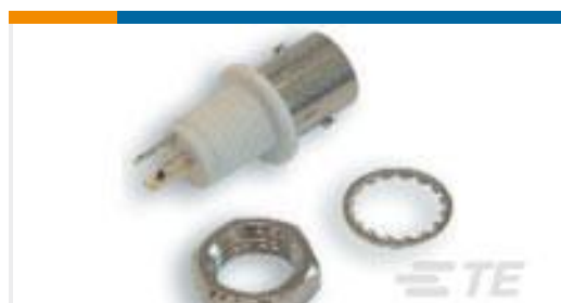
TE 产品编号1-1337452-0 BNC Ins BHSkt 50Ohm Nickel Gol