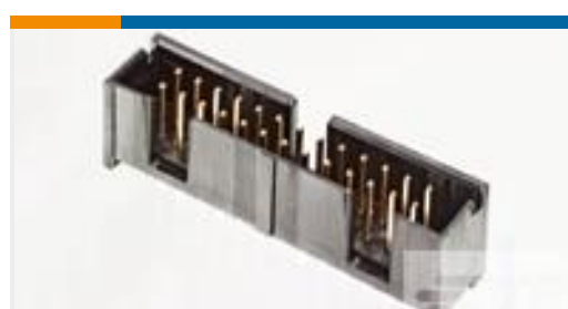
TE 产品编号5103309-6 A/L LOW PRO HDR 26P VERT BLACK