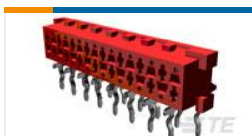
TE 产品编号7-215460-4 MICRO-MATCH FSID P