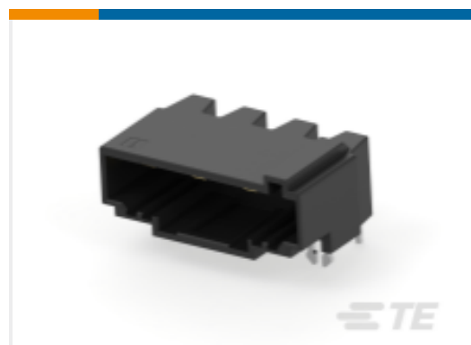
TE 产品编号1-2271457-8 Header Assembly: Wire-to-Board Connector, Spring Clamp, 7.5 mm pitch, 14.5A