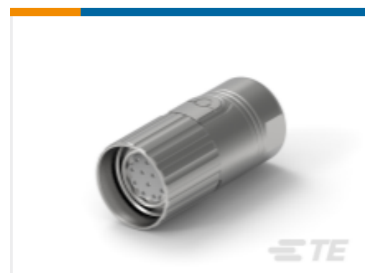
TE 产品编号ASA021N00210235000 623 PLUG