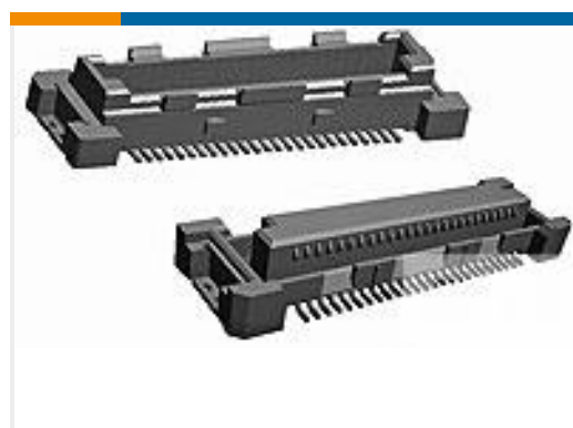
TE 产品编号1-5316316-0 .6FHP08H,140,S,GIG,08/Sn,HT,SEYes