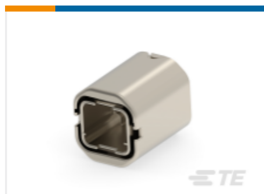
TE 产品编号2013874-1 ME CONN (M) DUMMY PLUG ASSY