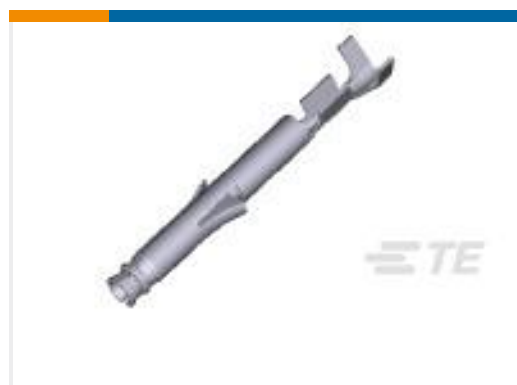
TE 产品编号1473226-1 SOCKET WITH RING MINI U-M-N-L