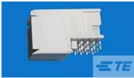
TE 产品编号120943-5 ASSEMBLY, R/A UPM RECPT, 7 POS