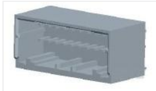
TE 产品编号3-1871056-1 DYNAMIC 1100D HDR ASSY V 22PX YELLOW TIN