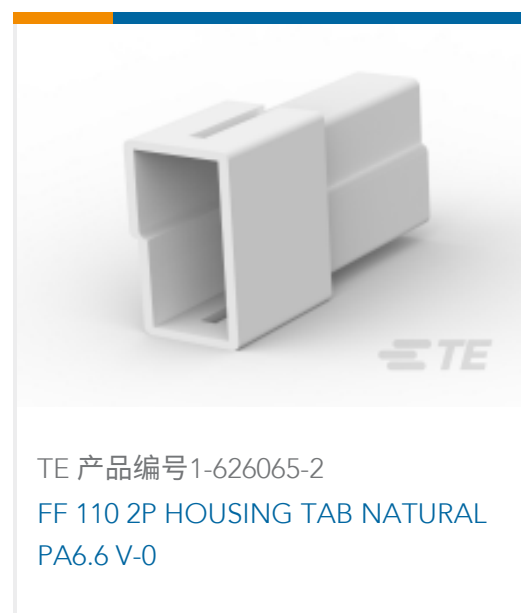
TE 产品编号1-626065-2 FF 110 2P HOUSING TAB NATURAL PA6.6 V-0