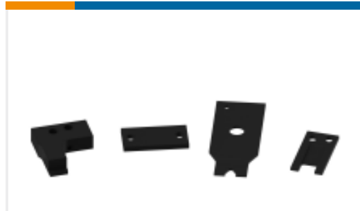
TE 产品编号3-459722-3 BLADE, SHEAR