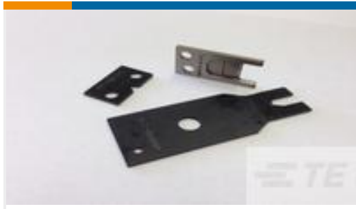
TE 产品编号1-690474-6 SHEAR BLADE