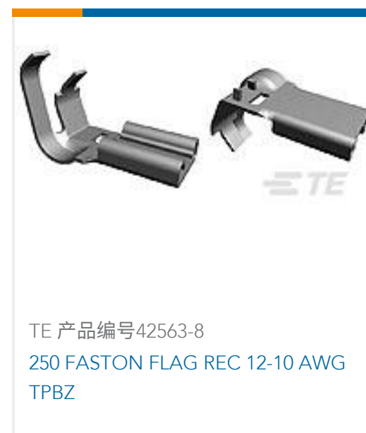
TE 产品编号42563-8 250 FASTON FLAG REC 12-10 AWG TPBZ