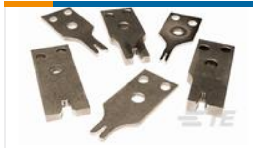
TE 产品编号5-683453-4 CRIMPER, INSULATION "F"