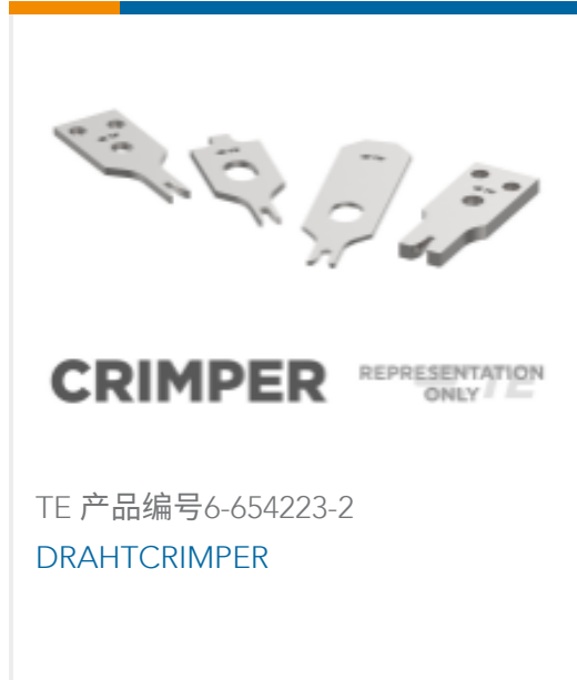
TE 产品编号6-654223-2 DRAHTCRIMPER