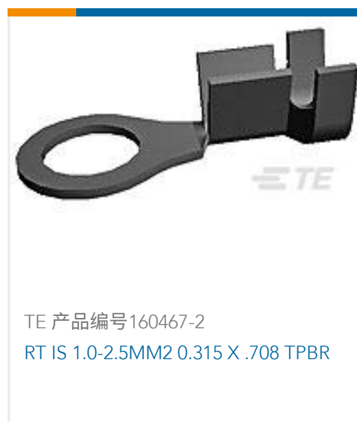
TE 产品编号160467-2 RT IS 1.0-2.5MM2 0.315 X .708 TPBR