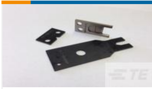
TE 产品编号4-240651-2 BLADE, SLUG