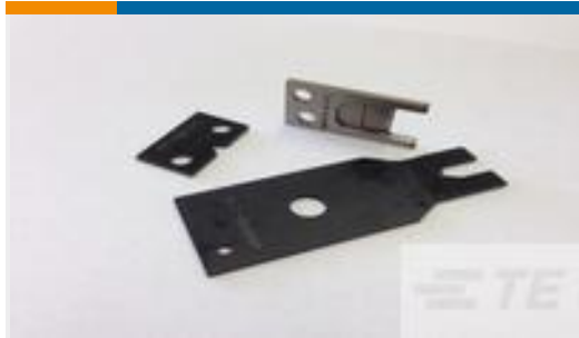
TE 产品编号690474-8 SHEAR BLADE