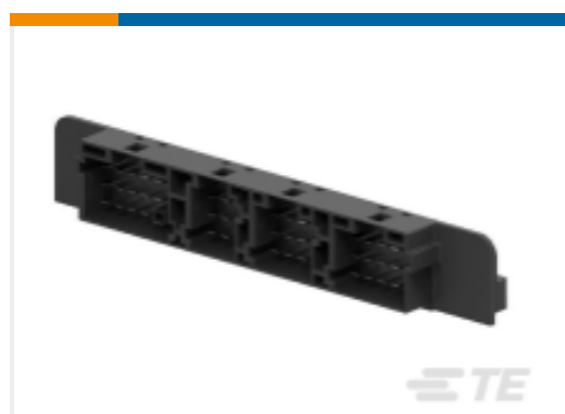
TE 产品编号1-1318384-4 High Pin Count Header