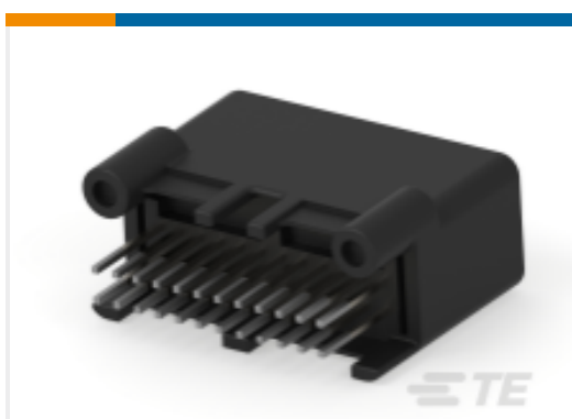
TE 产品编号1376111-6 025 24 POS CAP ASSY V