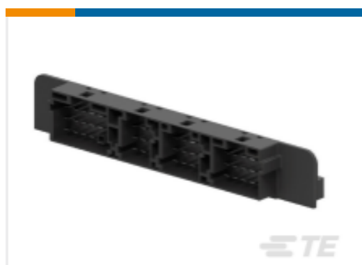
TE 产品编号1376113-5 High Pin Count Header