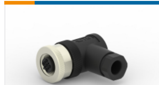
TE 产品编号T4112401041-000 M12,FEMALE,RA,B CODE,4P,PG7, GOLD