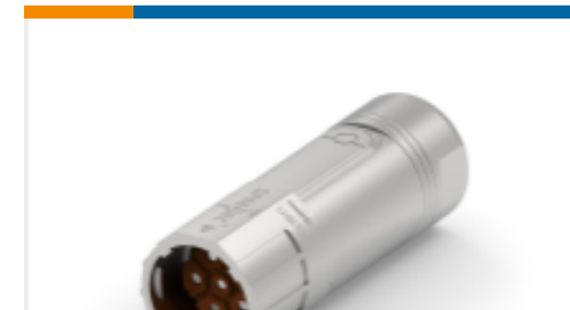
TE 产品编号BSA085N00480100000 923 PLUG, SPEEDTEC