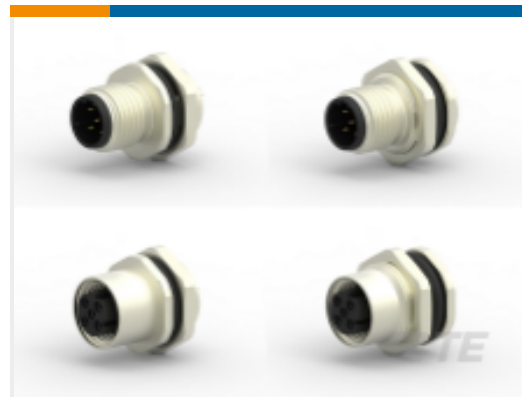
TE 产品编号 CAT-C73765-M1G M12 面板安装焊杯