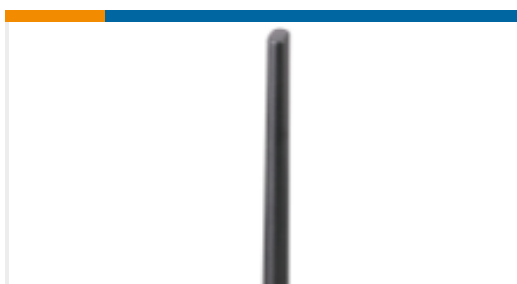
TE 产品编号L9000366-01 Antenna Wifi6/6E IP67 Blade SMA