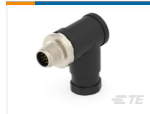
TE 产品编号 6-2271122-2 M12, MALE, A CODE, R/A, 12P, PG9 (AU)