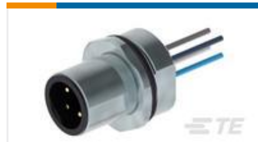
TE 产品编号6-2271134-2 M12,MALE PNL,A CODE,SOLDER REAR,12P,(AU)