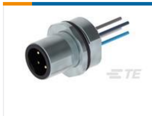
TE 产品编号 6-2271134-2 M12, MALE PNL, A CODE, SOLDER REAR, 12P, (AU)