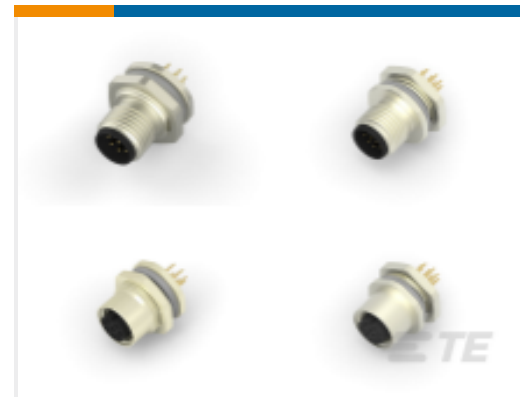
TE 产品编号 CAT-C73765-M1H M12 面板安装 PCB