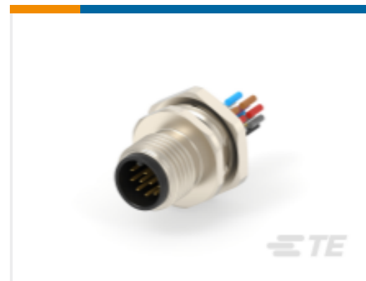
TE 产品编号 T4171230012-003 M12, FRONT MOUNT, MALE, A, 12P, 1.0M WIRE