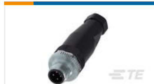
TE 产品编号6-2271110-2 M12, MALE, A CODE, 12P, PG9 (AU)