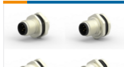
TE 产品编号T4130012121-000 M12 面板安装焊杯