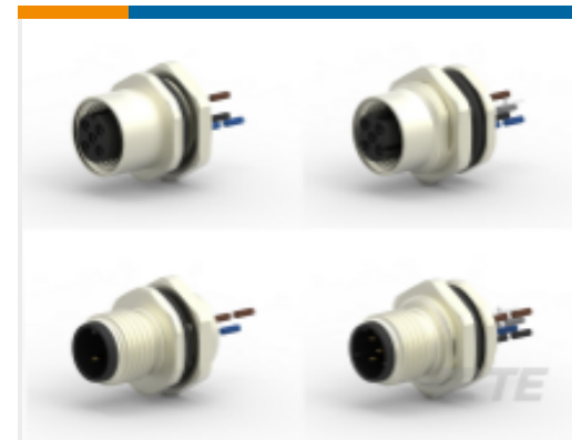
TE 产品编号 CAT-C73765-M1F M12 面板安装导线