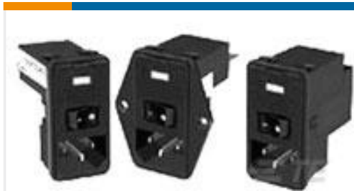
TE 产品编号6609108-6 PE0S0SZXC M0=C7046