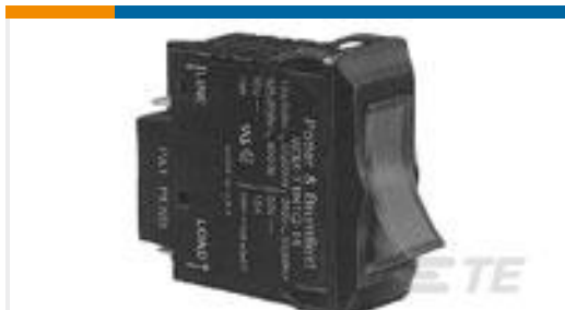
TE 产品编号2-1393248-6 W33-S4B1Q-15=W33