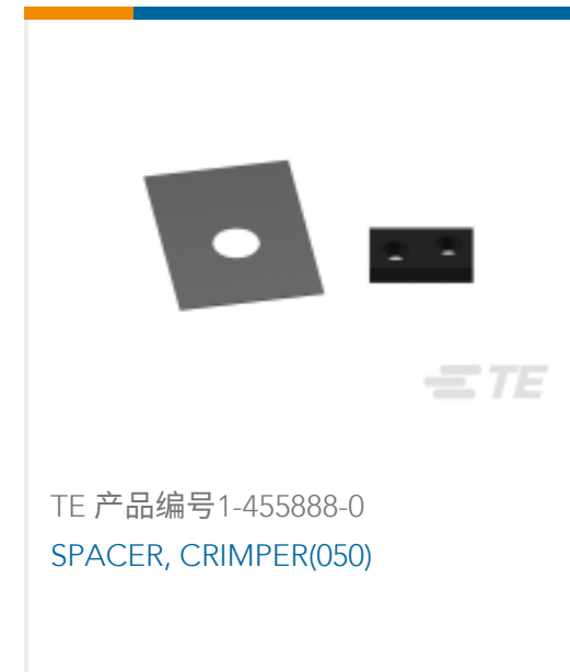
TE 产品编号1-455888-0 SPACER, CRIMPER(050)