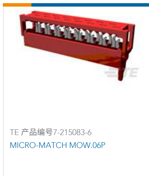
TE 产品编号7-215083-6 MICRO-MATCH MOW.06P