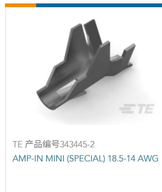
TE 产品编号343445-2 AMP-IN MINI (SPECIAL) 18.5-14 AWG