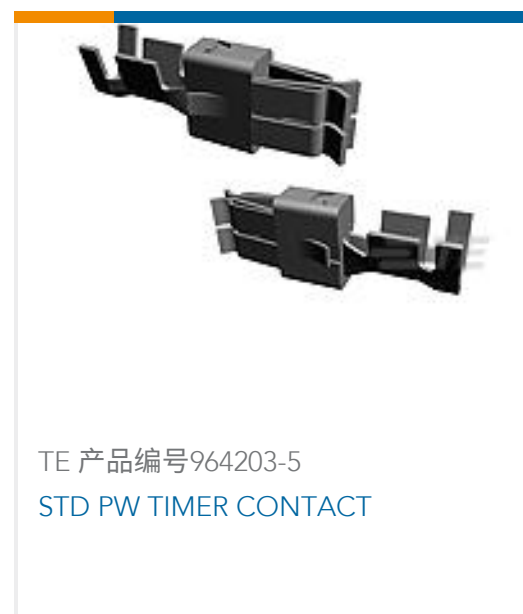
TE 产品编号964203-5 STD PW TIMER CONTACT