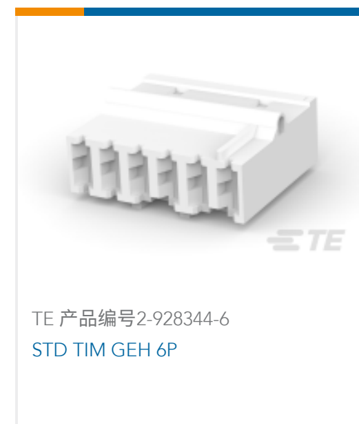
TE 产品编号2-928344-6 STD TIM GEH 6P