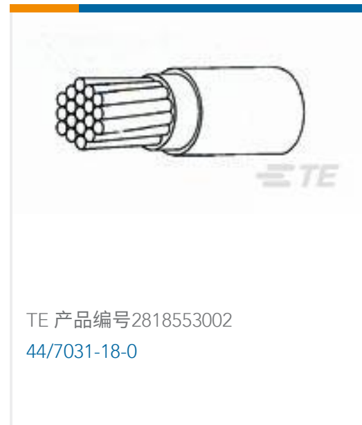
TE 产品编号2818553002 44/7031-18-0