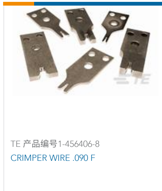
TE 产品编号1-456406-8 CRIMPER WIRE .090 F