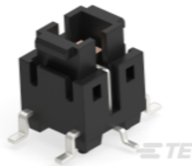
TE 产品编号 5-2213819-3 6X6 ILL TACT SMT 520GF LI SOFT ORANGE