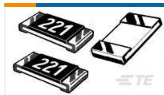
TE 产品编号1-2176231-8 3522 51R 1% 3W