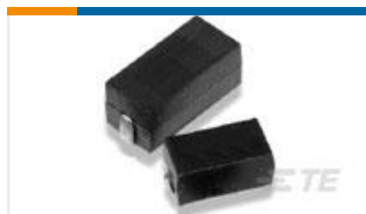
TE 产品编号2-1879234-3 SMF5 4K3 5%