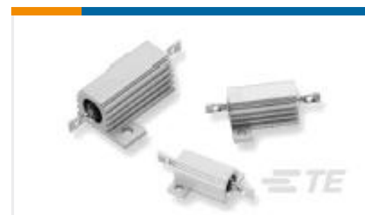
TE 产品编号1879071-2 THS50 R02 5%