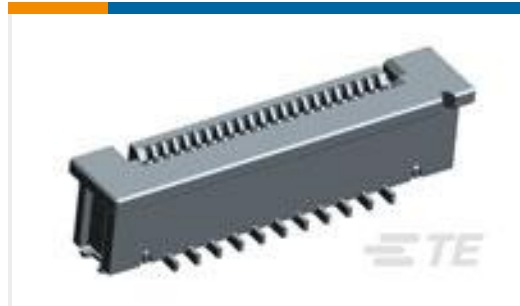
TE 产品编号1734742-6 .5 FPC VT ZIF Type-A 6 CONT