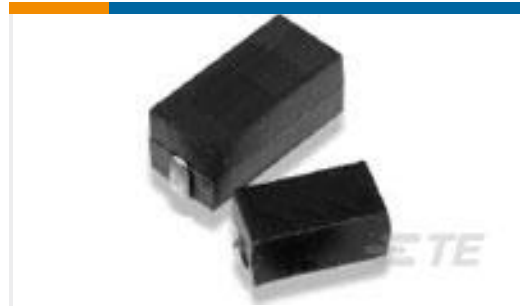
TE 产品编号7-1879022-3 SMF3 330K 5%