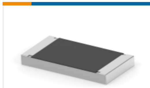
TE 产品编号1-2176350-1 CRGCO 2512 47R 5%