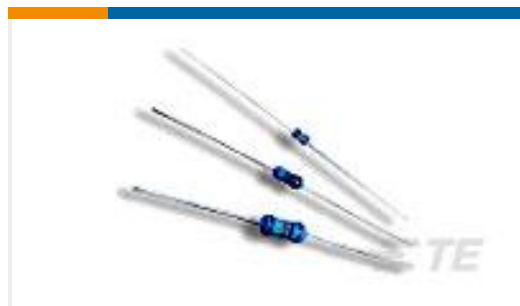
TE 产品编号1622480-1 LR1 1% 43R