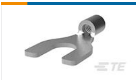
TE 产品编号130519 TERM, SOLIS, SPADE, 22-16, M4(8)