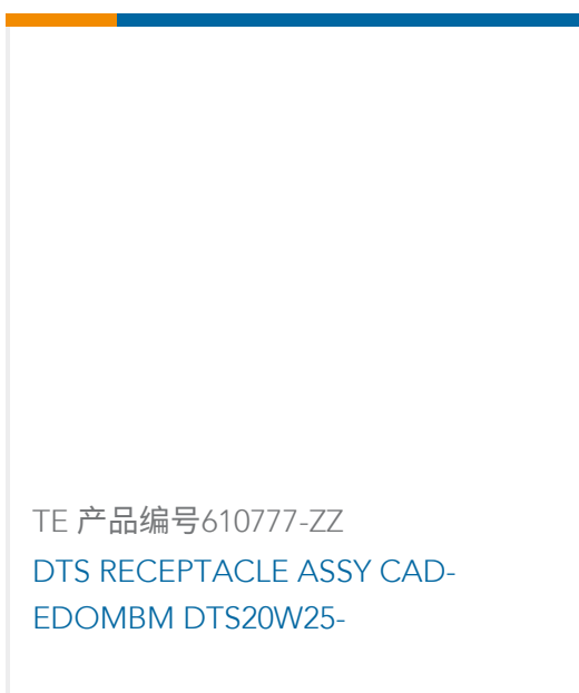
TE 产品编号610777-ZZ DTS RECEPTACLE ASSY CAD-EDOMBM DTS20W25-