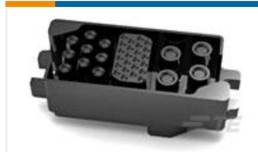
TE 产品编号6648167-1 CONN,SKT,75Amp MIDDLE DWR