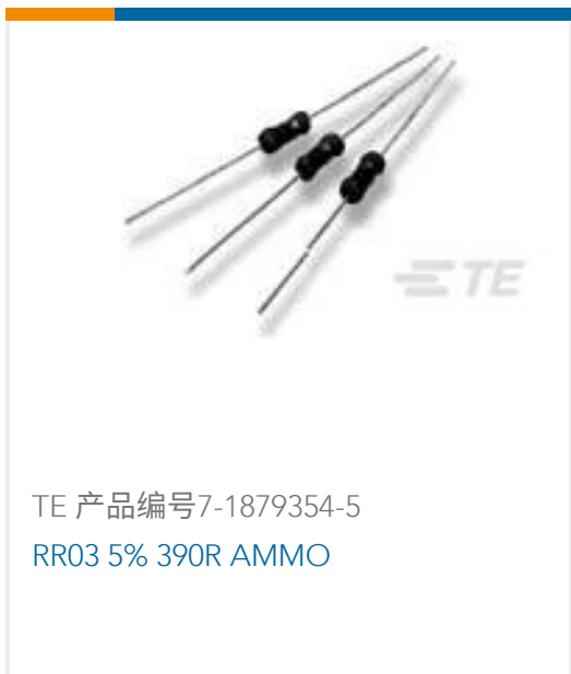
TE 产品编号7-1879354-5 RR03 5% 390R AMMO