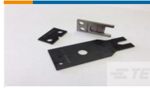
TE 产品编号2217206-1 Blade, Slug