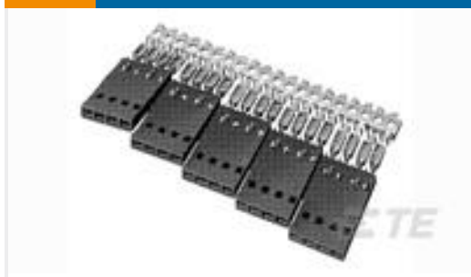
TE 产品编号5-103970-3 5X4 MTE RCPT SR RIBBED .100CL