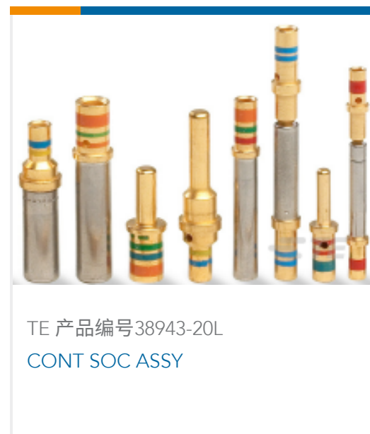
TE 产品编号 38943-20L CONT SOC ASSY