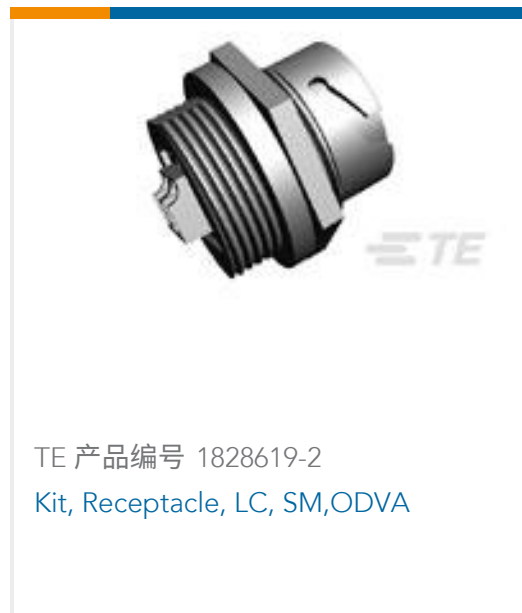
TE 产品编号 1828619-2 Kit, Receptacle, LC, SM, ODVA