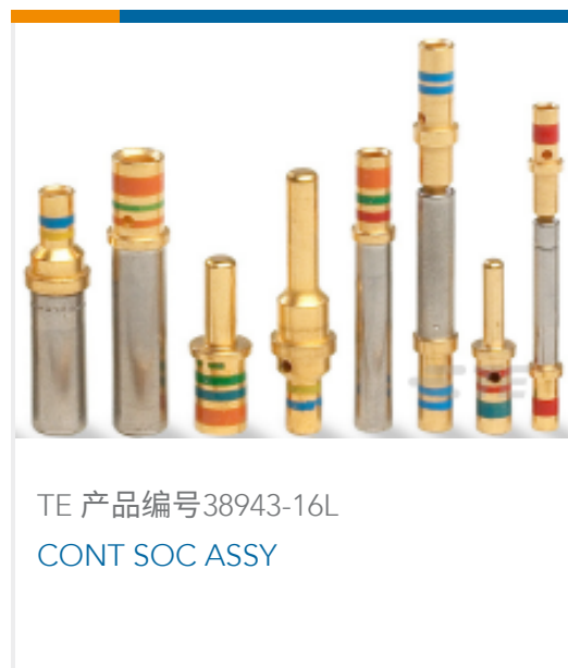
TE 产品编号 38943-16L CONT SOC ASSY