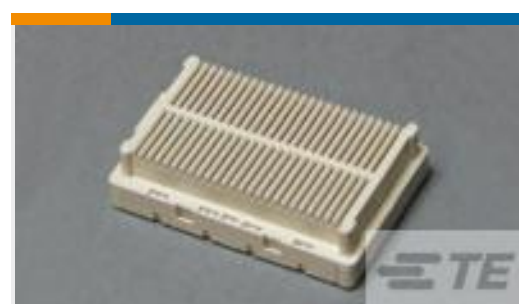
TE 产品编号 5-2007615-5 STEP-Z RCPT 05MM 200P LF HT