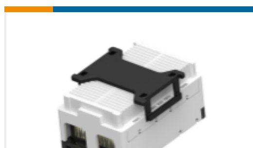
TE 产品编号 5-1761615-5 STEP-Z RCPT 05MM 200P LF ST