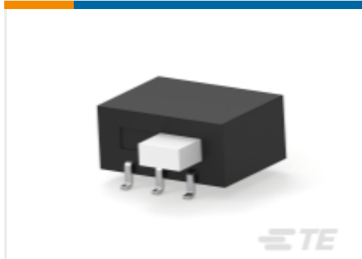
TE 产品编号1-1437581-1 ASE22RL=AUTOSLIDE DP