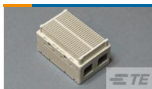
TE 产品编号 6-1761615-1 STEP-Z RCPT 11MM 200P LF ST