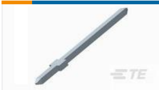
TE 产品编号1-928836-2 MOD2 PIN WITH A-PIN L/P