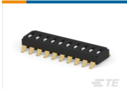
TE 产品编号3-2319848-1 END STACK DIP 10P G RECESS SEAL TUBE