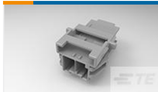
TE 产品编号5-1971772-2 PTL 1X2 CAP PANEL MT HITEMP KEY A LGR