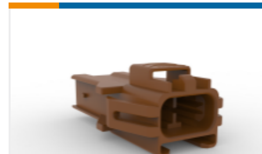
TE 产品编号3-2378158-2 Power Versa-Lock CAP, 1X2 KEY C