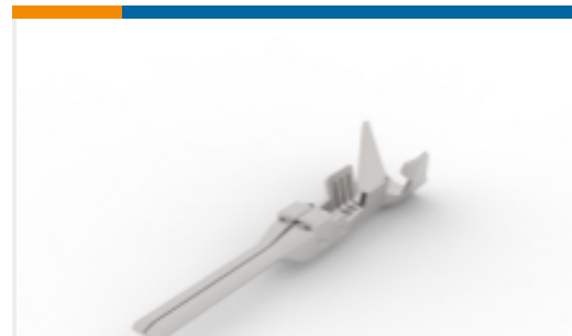
TE 产品编号2329908-1 Power Versa-Lock SEAL TAB, 18-20 AWG