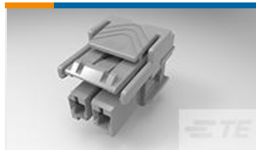
TE 产品编号8-1971773-2 PTL 1X2 PLUG HSG HIGH TEMP KEY D NAT