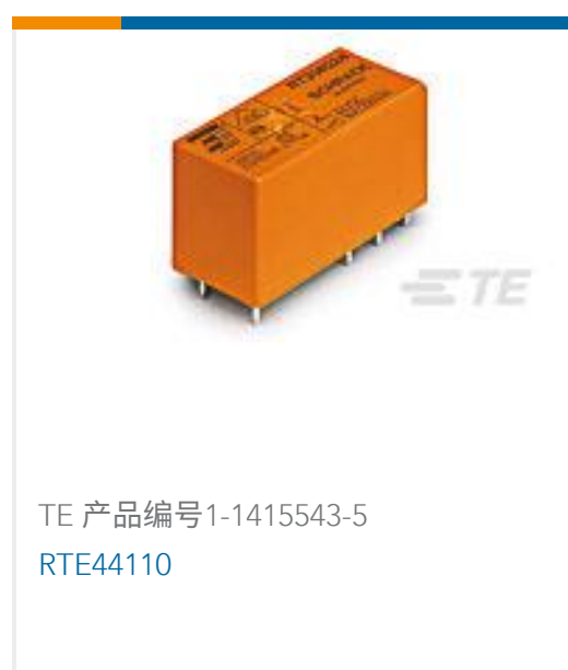
TE 产品编号1-1415543-5 RTE44110