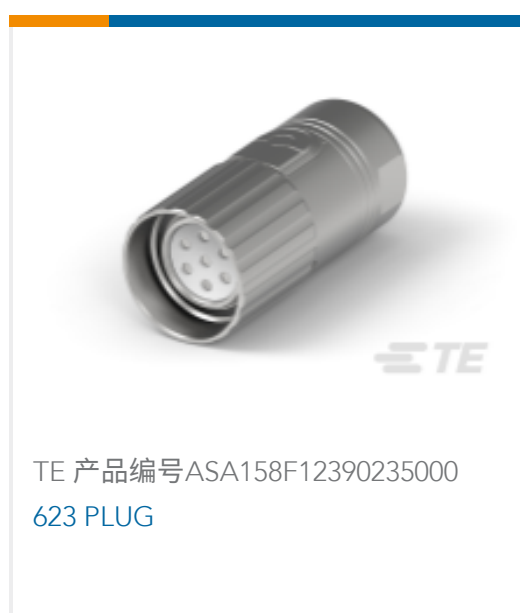
TE 产品编号ASA158F12390235000 623 PLUG