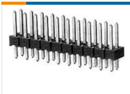
TE 产品编号7-146256-0 40 MODII HDR DRST B/A .100CL L