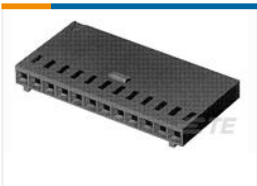
TE 产品编号1-102241-8 20 MODIV HSG COMP SR .100 POL