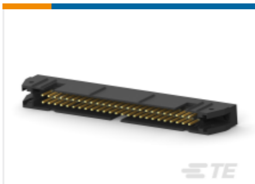
TE 产品编号1-5499141-0 AMP 锁门通用插头