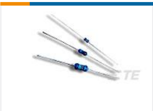
TE 产品编号8-1676914-1 YR1 0.1% 64R9