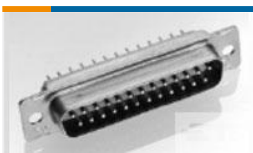
TE 产品编号211529-1 AMPLIMITE,ASY,RCPT,FB,109,5