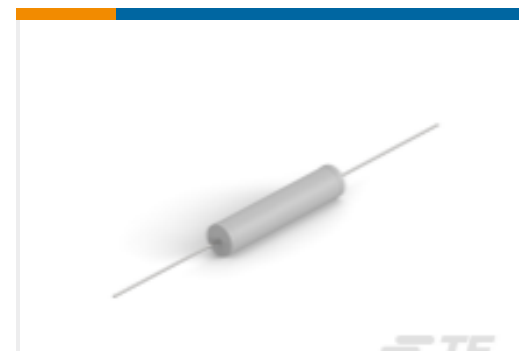
TE 产品编号9-2176415-0 8W STD M/OX 5% 150K