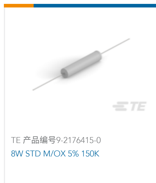
TE 产品编号 9-2176415-0 8W STD M/OX 5% 150K