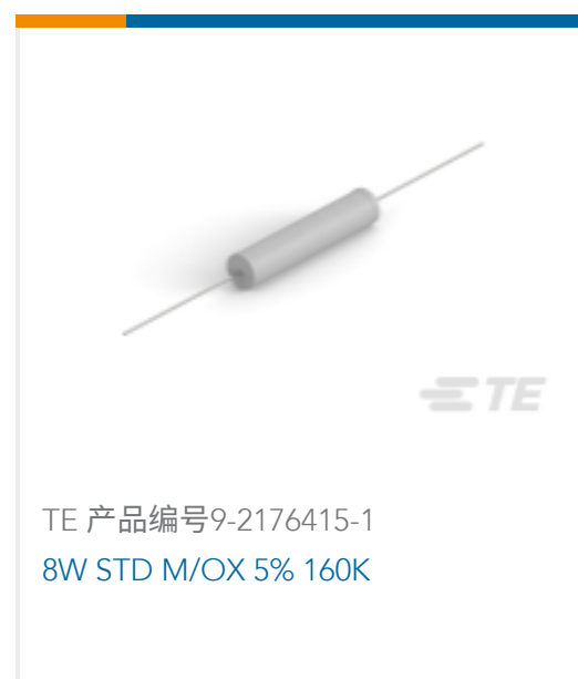
TE 产品编号 9-2176415-1 8W STD M/OX 5% 160K