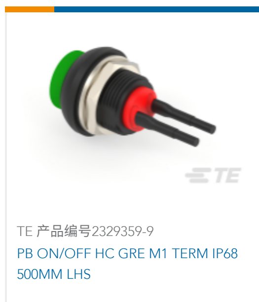
TE 产品编号 2329359-9 PB ON/OFF HC GRE M1 TERM IP68 500MM LHS