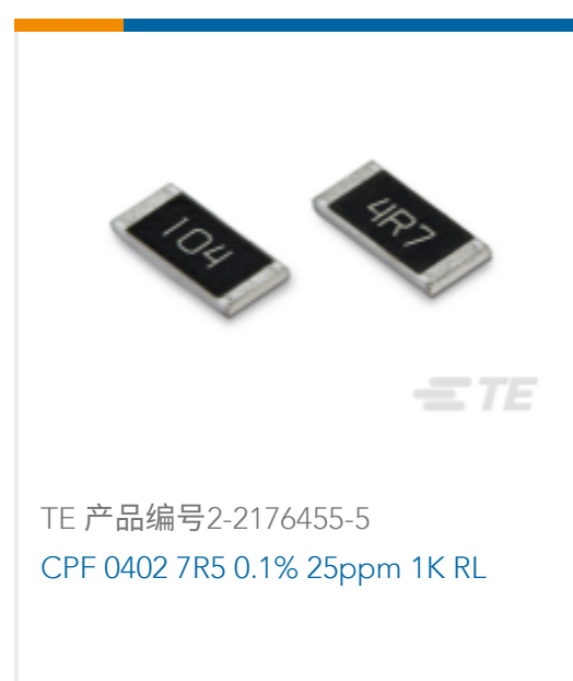
TE 产品编号 2-2176455-5 CPF 0402 7R5 0.1% 25ppm 1K RL