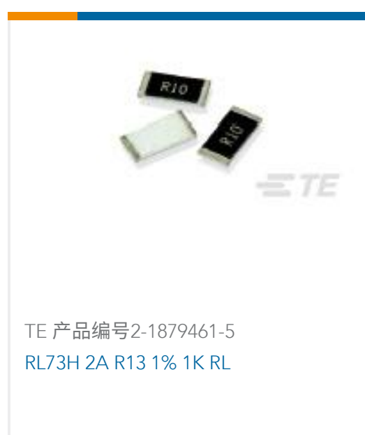
TE 产品编号 2-1879461-5 RL73H 2A R13 1% 1K RL