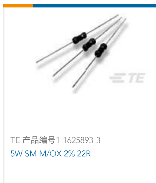
TE 产品编号 1-1625893-3 5W SM M/OX 2% 22R