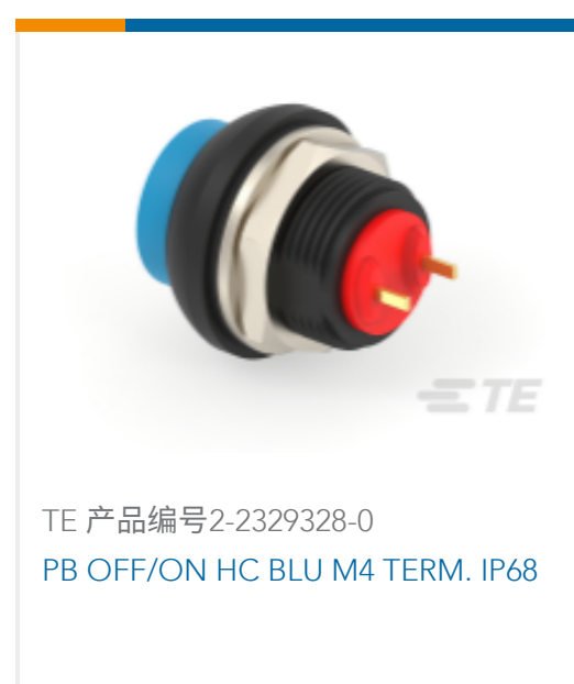
TE 产品编号 2-2329328-0 PB OFF/ON HC BLU M4 TERM. IP68