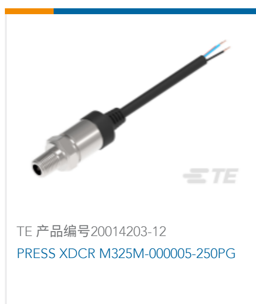
TE 产品编号 20014203-12 PRESS XDCR M325M-000005-250PG