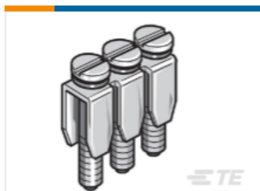
TE 产品编号1SNA173615R2500 BJM10