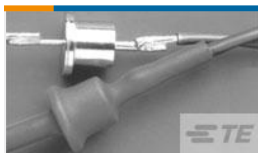
TE 产品编号5677552005 RNF-3000-1.5/0.5-0-STK