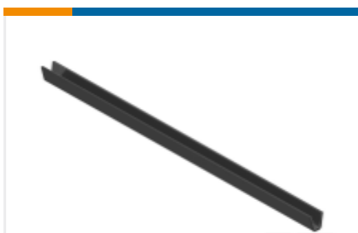
TE 产品编号4426614007 RAYRIM-NR9-0-SP