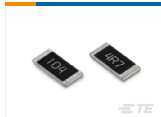
TE 产品编号2-2176455-5 CPF 0402 7R5 0.1% 25ppm 1K RL