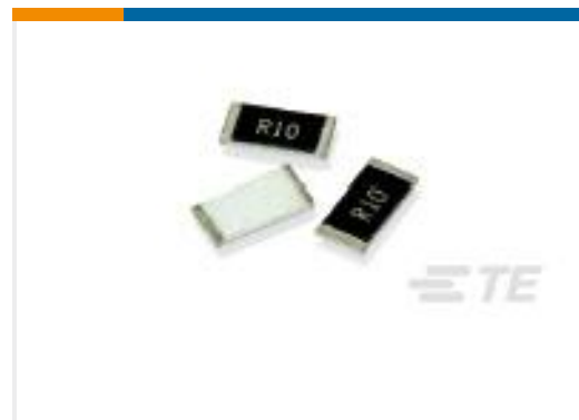
TE 产品编号2-1879461-5 RL73H 2A R13 1% 1K RL