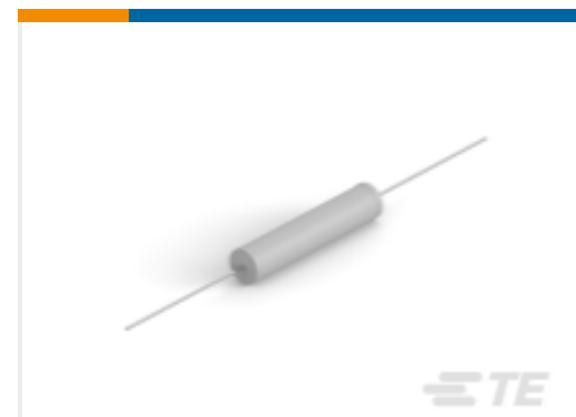
TE 产品编号9-2176415-0 8W STD M/OX 5% 150K