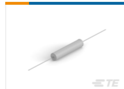
TE 产品编号9-2176415-1 8W STD M/OX 5% 160K