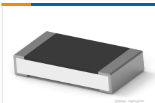
TE 产品编号1-2176391-0 RQ 1206 15K4 0.1% 10PPM 5K RL