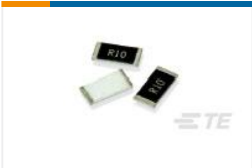
TE 产品编号2-1879461-5 RL73H 2A R13 1% 1K RL