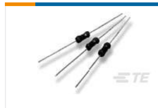
TE 产品编号1-1625893-3 5W SM M/OX 2% 22R