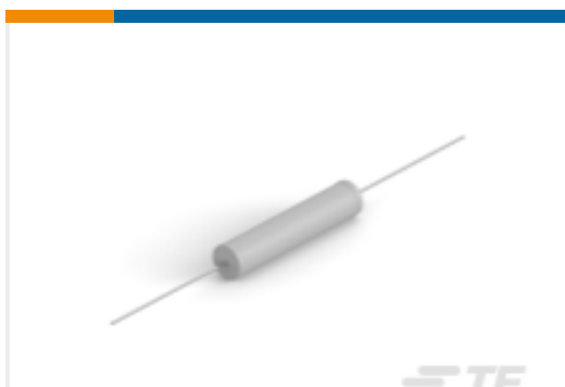
TE 产品编号9-2176415-1 8W STD M/OX 5% 160K