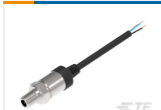
TE 产品编号20014203-12 PRESS XDCR M325M-000005-250PG