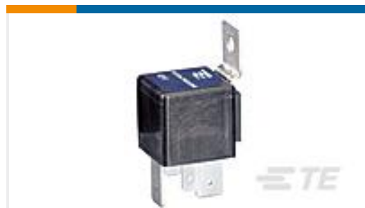
TE 产品编号3-1415001-2 V23134J0052X511-EV-CBOX