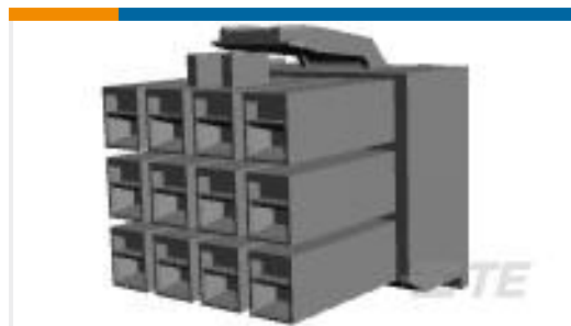
TE 产品编号176278-9 UNIV POWER PLUG HSG 12P F/H