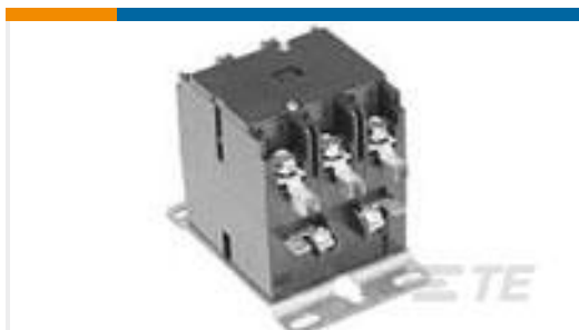
TE 产品编号4-1611009-6 3100-30Q10999CG=40A 3P 24V MOD