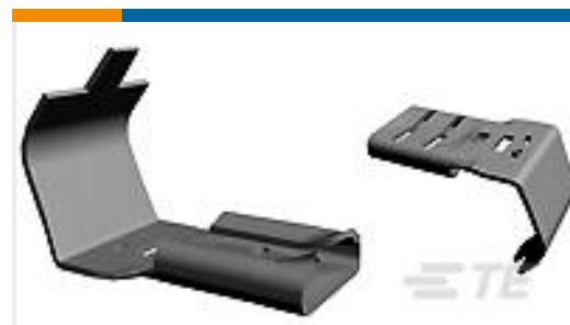
TE 产品编号62091-2 250 FLG FAST RCPT 18-12 PTPBR