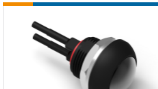
TE 产品编号2329362-1 PB OFF/ON RC BLK M1 TERM IP68 500MM LHS