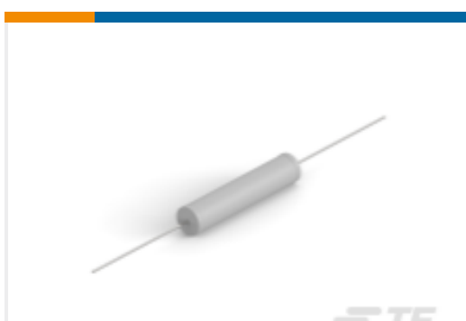
TE 产品编号9-2176415-1 8W STD M/OX 5% 160K