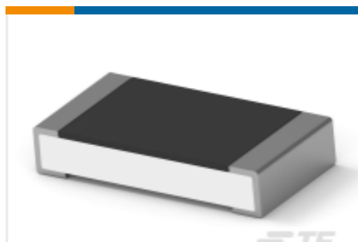
TE 产品编号1-2176391-0 RQ 1206 15K4 0.1% 10PPM 5K RL