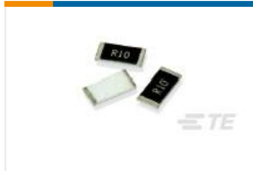
TE 产品编号2-1879461-5 RL73H 2A R13 1% 1K RL