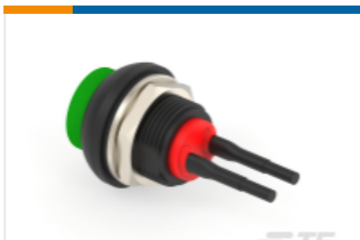
TE 产品编号2329359-9 PB ON/OFF HC GRE M1 TERM IP68 500MM LHS