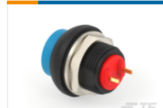
TE 产品编号2-2329328-0 PB OFF/ON HC BLU M4 TERM. IP68