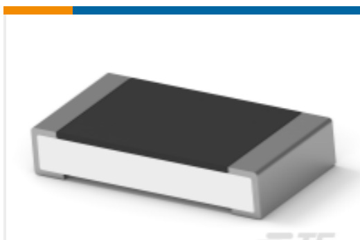
TE 产品编号1-2176391-0 RQ 1206 15K4 0.1% 10PPM 5K RL