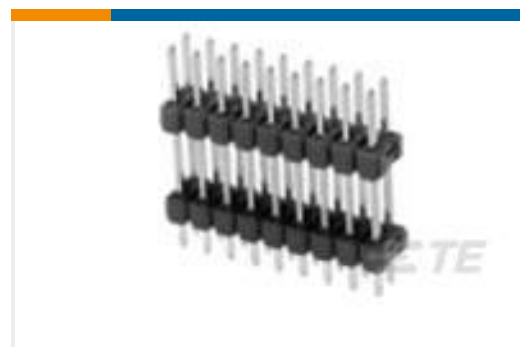
TE 产品编号5-146496-2 04 MODII HDR DRST UNSHRD STKG